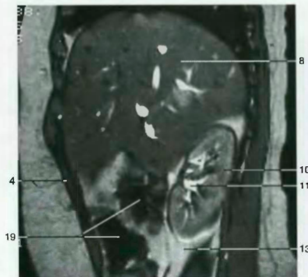
Парасагиттальный разрез брюшной полости. (MR-томограмма)