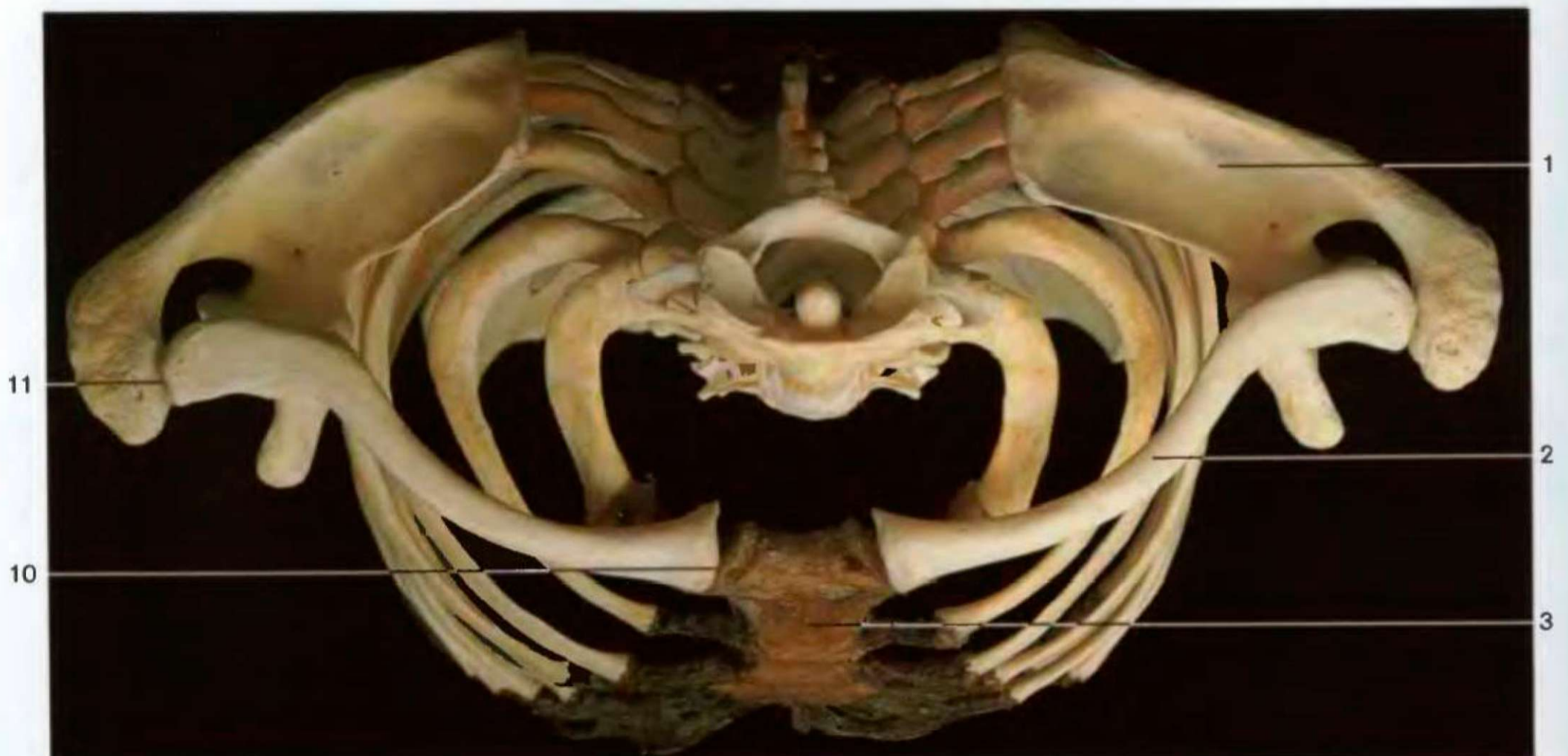
Кости плечевого пояса, соединенные с грудной клеткой (вид сверху)

Строение плечевого пояса и верхней конечности (вид сверху). Два основных положения предплечья, позволяющих человеку выполнять основные навыки: вращение внутрь — супинация (правая рука) и вращение наружу — пронация (левая рука)