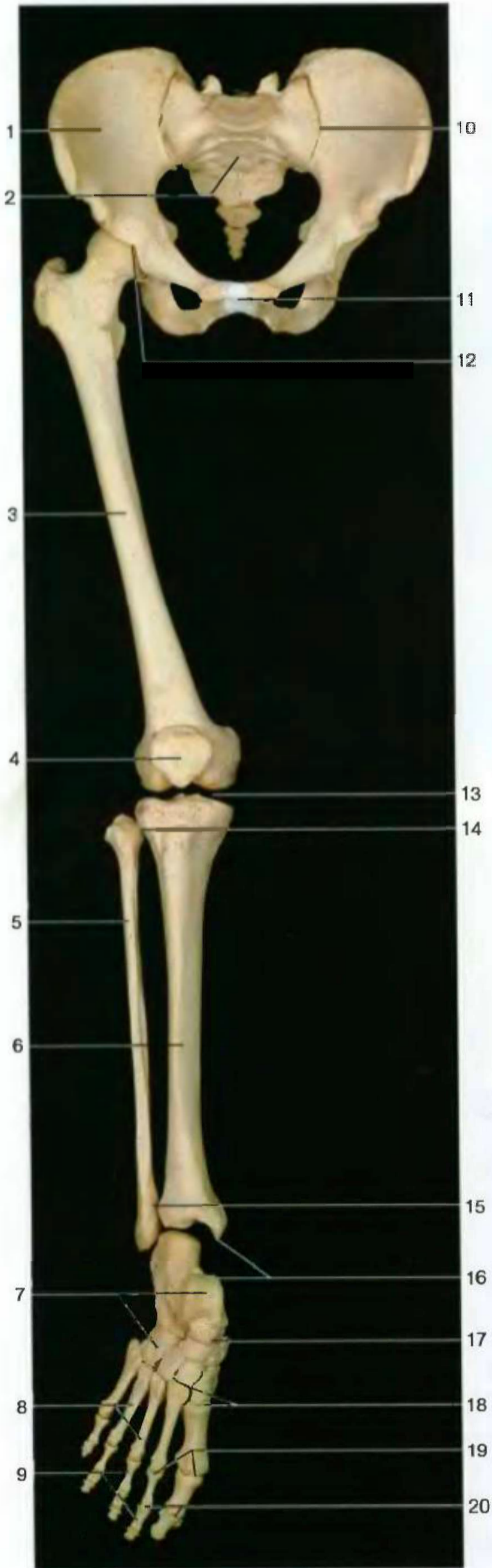
Скелет тазового пояса и нижней конечности (вид спереди). Голеностопный сустав смещен